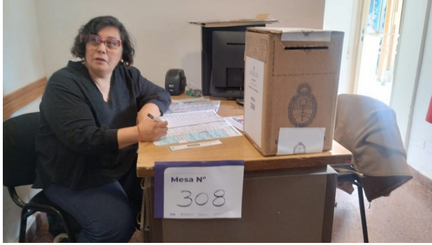
Mesa electoral de la Unidad 16