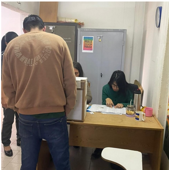
Persona votando en la Unidad 11