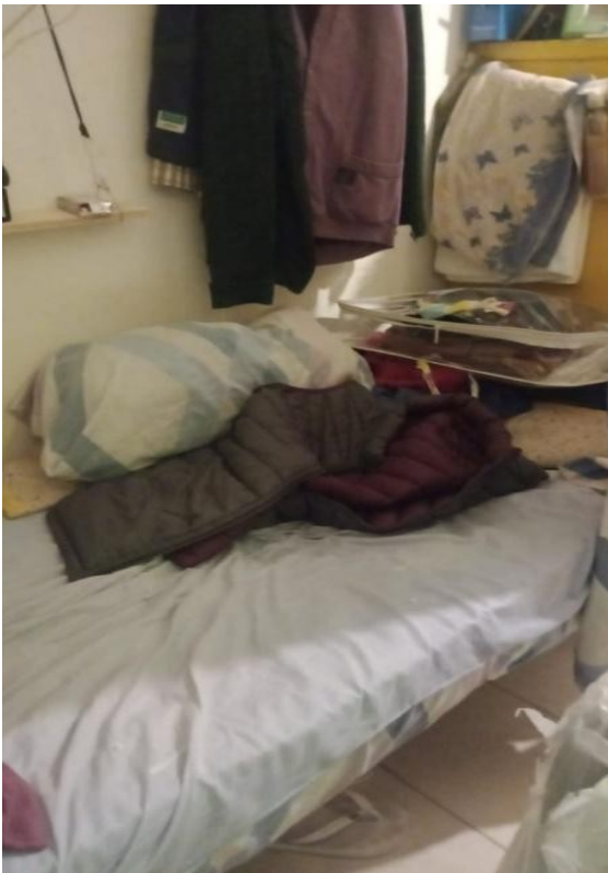
Pabellón 10. Celda y ducha de baño