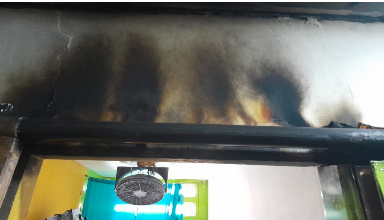
Pabellón 4. Paredes quemadas