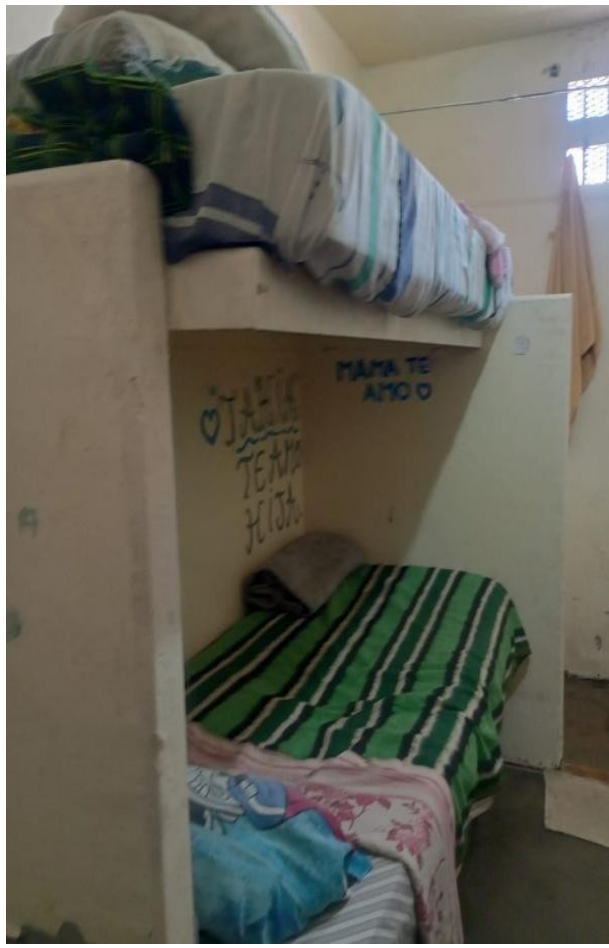
Comedor hacinado (11 personas sentadas, y son 19)