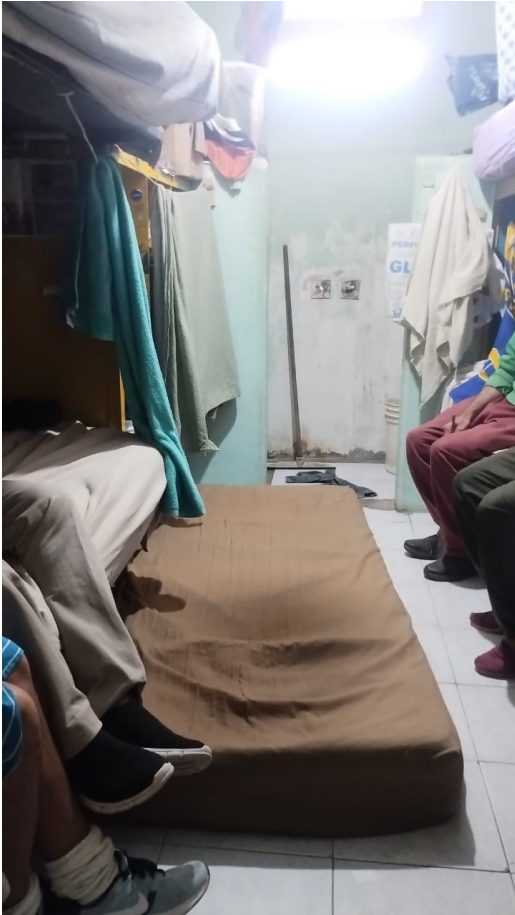
Pabellón 9. Celdas sobrepobladas