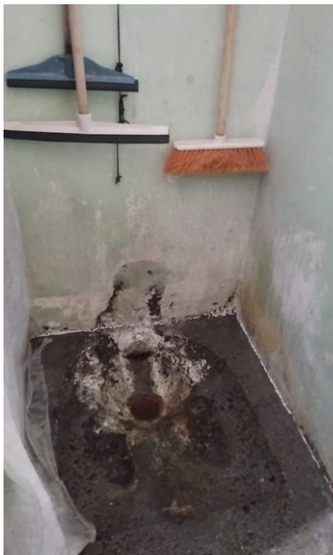
Pabellón 9. Baño de celda