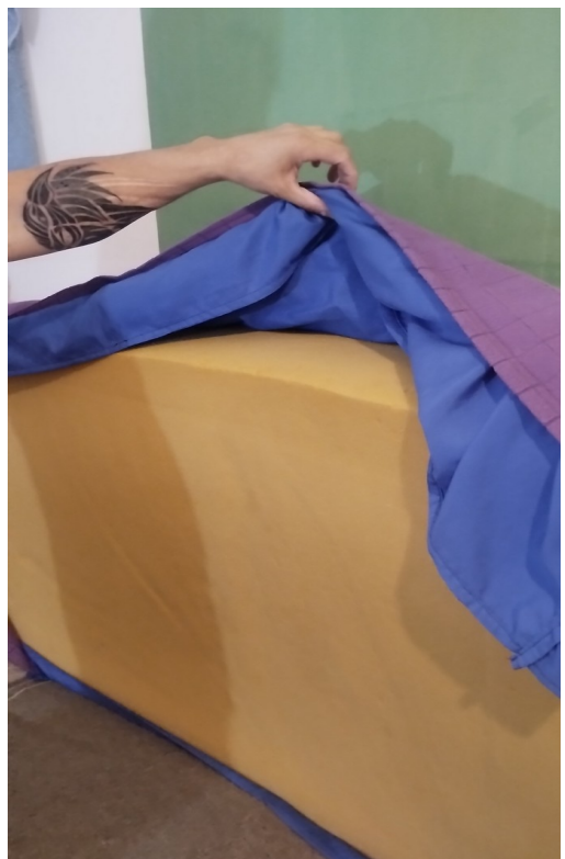
Pabellón 10. Colchón dañado y sin densidad