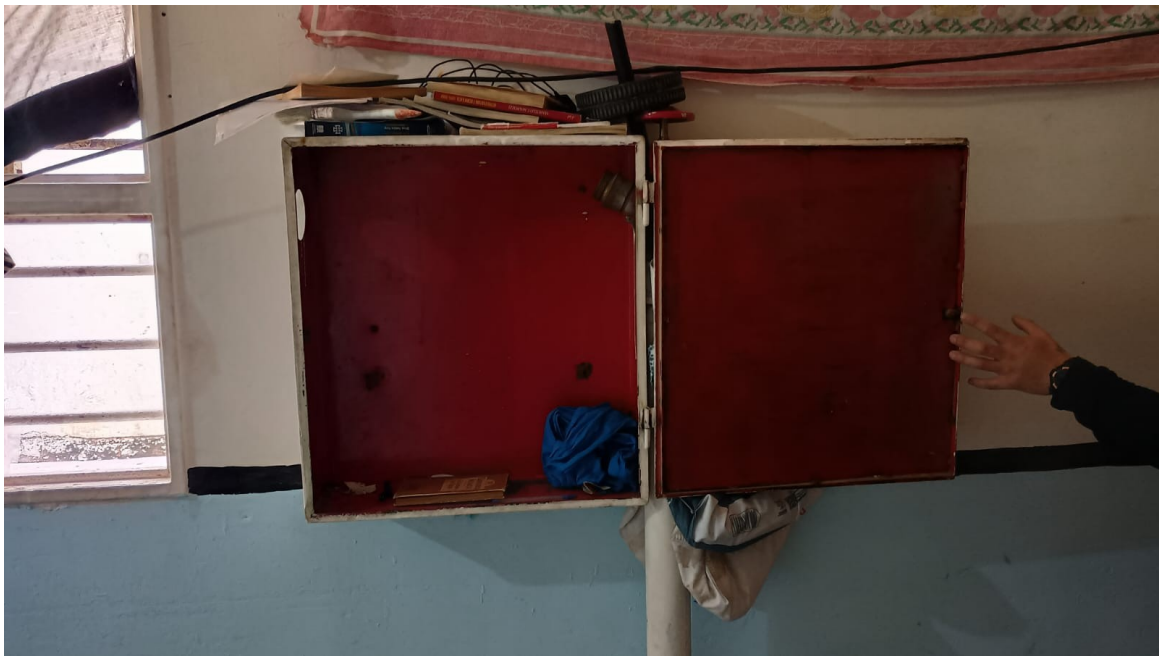
Falta de manguera contra incendios