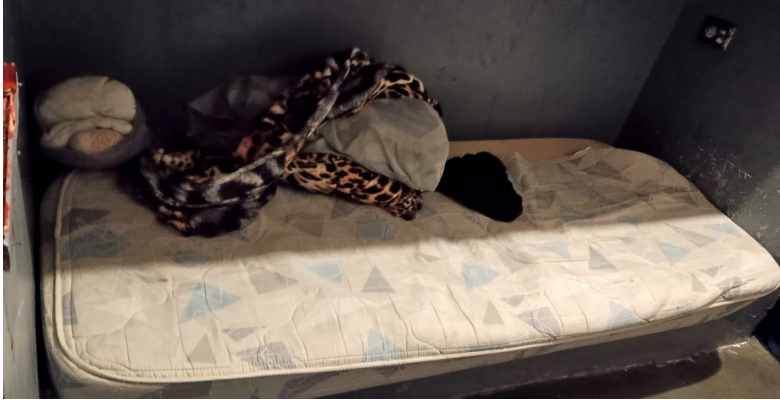
Colchones en mal estado