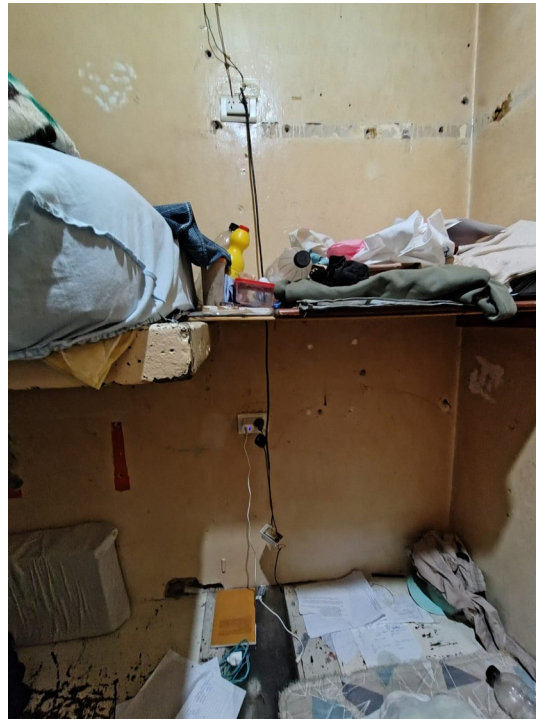
Instalaciones eléctricas precarias